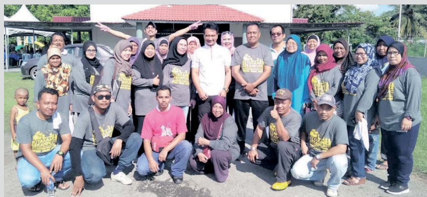
Sebahagian penduduk menyertai gotong royong-royong berkenaan.