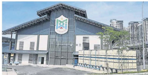
山力花园新巴刹将在 1 月 26 日运作。

他说，新巴刹建好后，早市小贩一样为摆卖地点而烦，现有临时摆卖地点为私人地，有关发展商已在 1 月 10 日发函给早市小贩，要求他们在 1 月 15 日迁离。