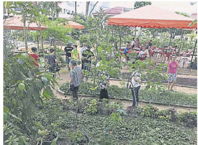
居民同心协力，将荒地耕耘成为绿油油的花园。