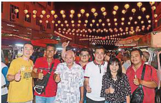
500粒红彤彤灯笼互相辉映，成为拍照“打卡”胜地。