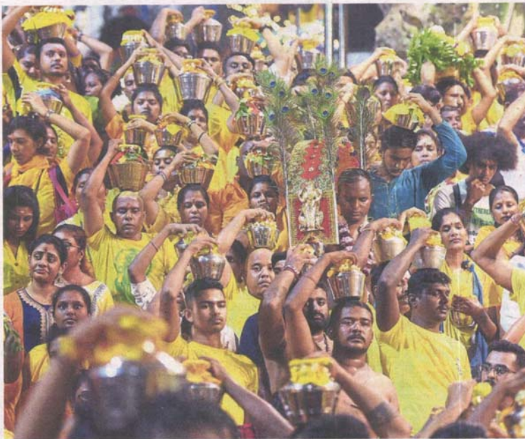
A day for prayers and penance: Devotees carrying kavadis and milk pots while walking towards the Batu Caves temple during Thaipusam.