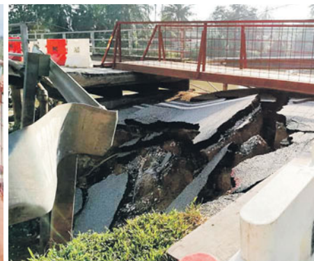
Hakisan sungai yang semakin serius akan dibaiki JKR Daerah Kuala Selangor bermula 28 Januari nanti.

minta mengulas perkembangan terkini status jambatan di kampung itu.