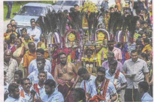
Walk of devotion: Hindu devotees making their way to the Sri Subramaniam temple in Ringlet, Cameron Highlands.

KUALA LUMPUR: The peaceful Thaipusam celebration this year affirms the fact that Malaysians are able to enjoy freedom of religion, says National Unity and Social Well-being Minister P. Waytha Moorthy.