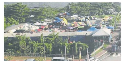
在私人地上摆卖的山力花园早市。

他说，山力花园巴刹小贩以蛋禽小贩为主，有整 90 档；没列在搬迁计划内的早市小贩可说见步步行。