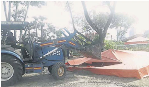
无情的铲泥机将花园的棚架铲平。