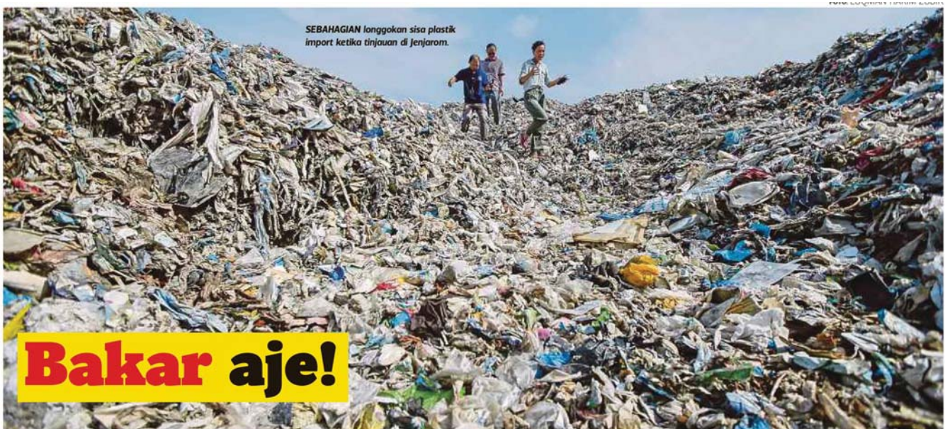
SEBAHAGIAN longgokan sisa plastik import ketika tinjauan di Jenjarom.