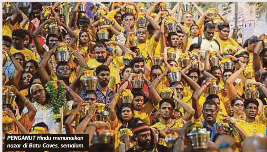
PENGANUT Hindu menunaikan nazar di Batu Caves, semalam.

"Saya mengucapkan selamat menyambut Hari Thaipusam kepada seluruh rakyat Malaysia terutama mereka yang bermastautin di Selangor," katanya.